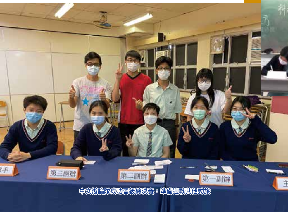
中文辯論隊成功晉級總決賽，準備迎戰其他勁旅

每一場校際比賽的辯題，盛載着我那寶貴的回憶，至今仍歷歷在目。辯論雖然是一項冷門的活動，但對於曾為光中辯論隊的一員，無疑是令人感到自豪的。