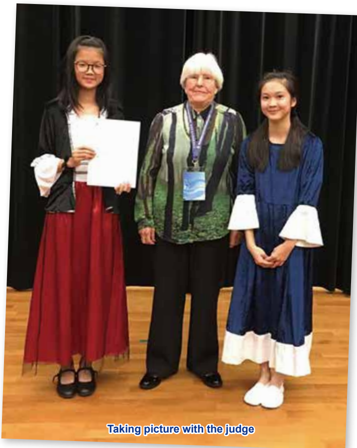
Taking picture with the judge