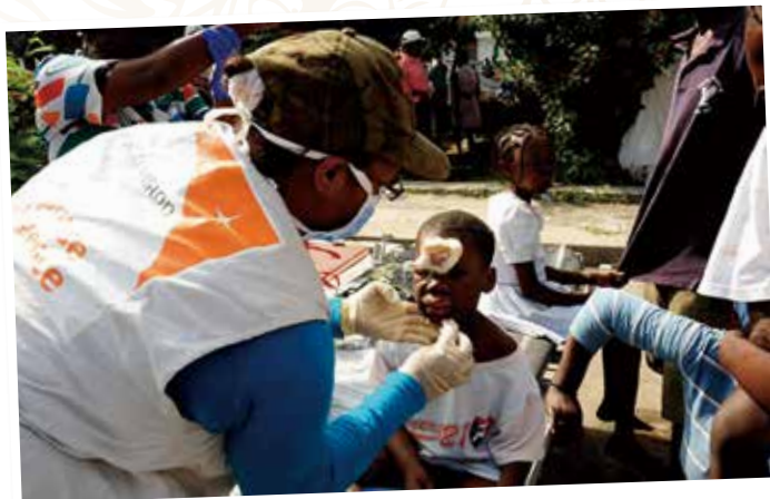
索馬里環境危險，時有衝突和流血事件發生

我曾經歷真實的危險的狀況，但有幸不至於涉及生死。我曾遇過爆炸，與我距離頗近，幸好不是在我住的地方；又如四川地震後，路面陡斜，泥石鬆散，我們乘坐的車輛或有失控，差點從高處掉下；又例如在索馬里，經常聽到槍聲，就在我附近，較幸運的，是我附近仍未曾發生過爆炸。我心存感恩，至今仍未受過重傷，亦未經歷與死亡十分接近的時刻。