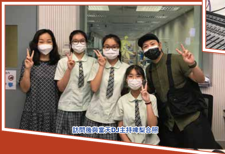
訪問後與當天DJ主持啤梨合照

廣播劇，聽眾只能聽見聲音，卻不能看到演員的面部表情或肢體動作。然而，作為廣播劇演員，當我們一投入演繹時，面部表情和肢體動作都需要運用，這能協助我們增強語氣，令我們的聲音更具感染力。