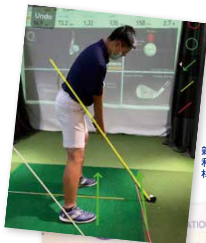
新冠疫情無阻訓練，利用科學數據化的器材提升球技的精準度

人生還有一段很漫長的旅程，很慶幸自小有緣接觸高爾夫球，更感恩遇上兩位好教練及父母無條件的支持，和學習過程中幫助及鼓勵我的人！我相信現在所學到的道理必定能夠在我未來的日子裏派上用場的！