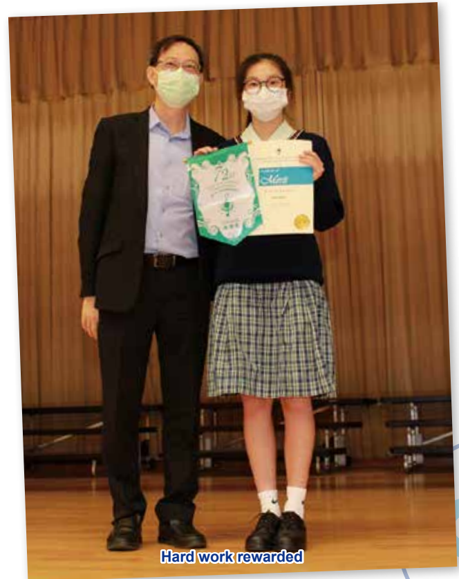
Hard work rewarded

My speaking was poor, though I liked to talk. People didn't understand my words, as my speeches' organisation was chaotic. During the practice of dramatic duologue, I learnt the application of plenty of oral skills. I am now more confident to speak to the public, and have even become active in school.