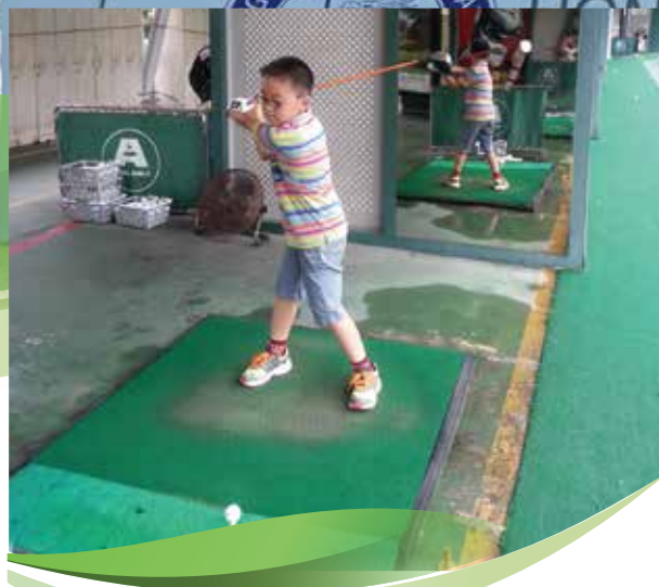
小時候第一次接觸高爾夫球，便愛上了這項運動