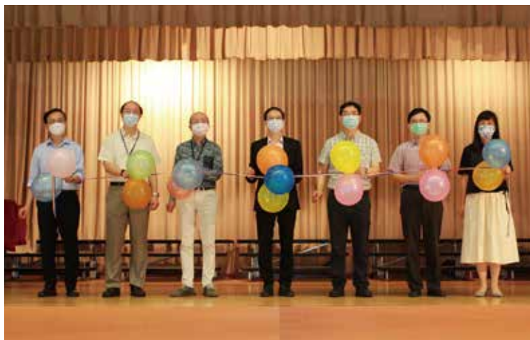
數理學術周開幕禮

我們向來樂意挑戰自己，又想著能為社出一分力，便答應了參加數理周問答比賽。我們找了班上相熟的同學，一起組隊參加是次比賽。比賽前，我們不斷複習奧數班的題目，看了一遍又一遍。雖然很久沒有做過這類型的題目，但是解題的方式仍然深深地烙印在我們腦海裏，記憶就像昨日發生般清晰。由於準備充足，我們充滿了信心，勢必為社爭光。