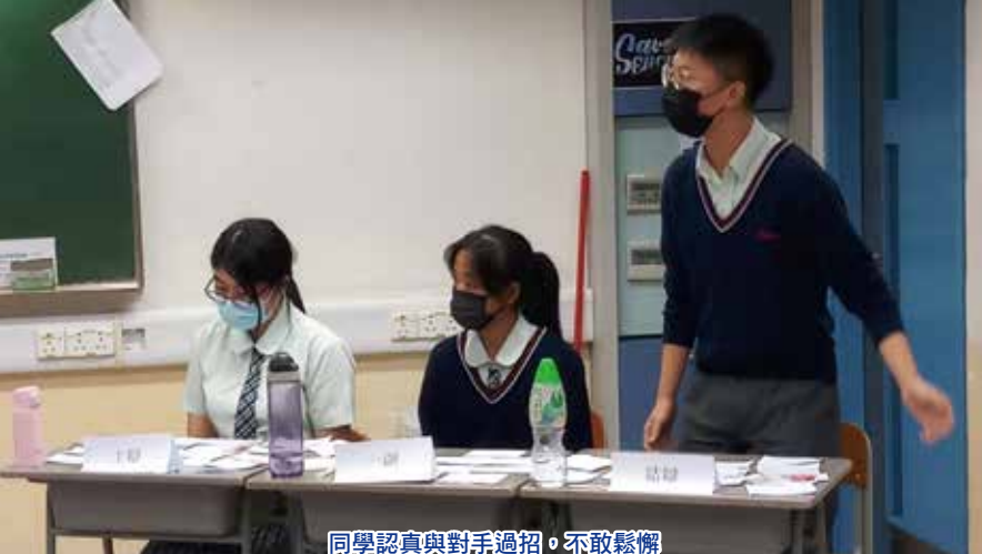
同學認真與對手過招，不敢鬆懈